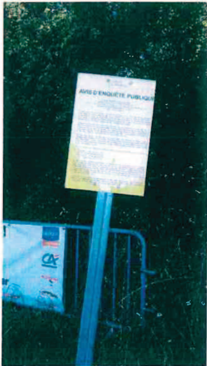
Rond-Point de Beats Me (Talhouët)