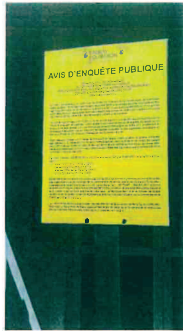
Mairie annexe de Pluvigner à Bieuzy-Lanvaux