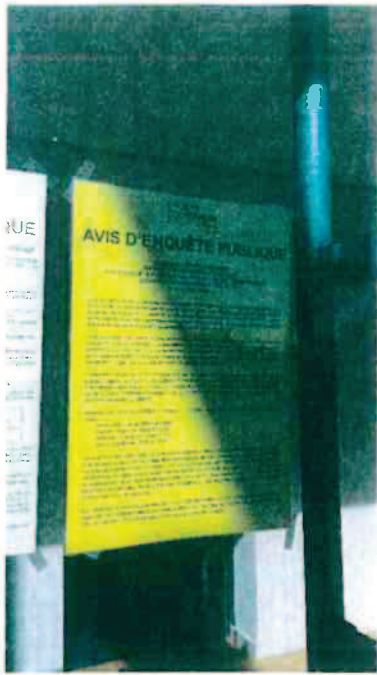
Mairie de Pluvigner