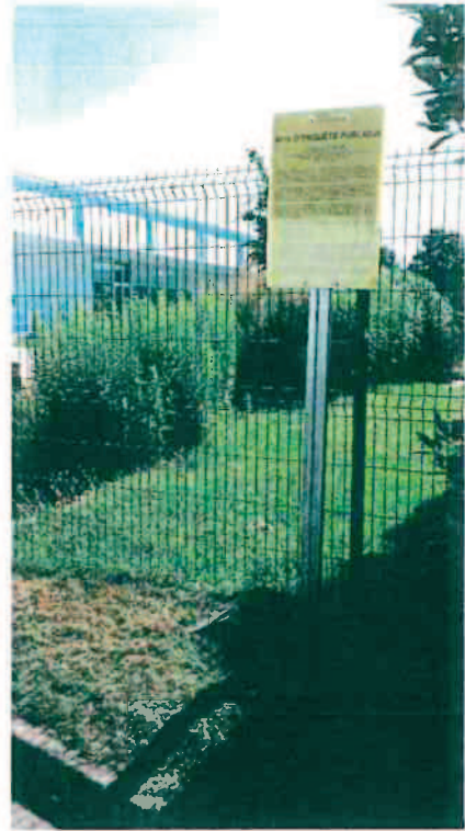
Salle de sport Marie Joséphe Le Borgne