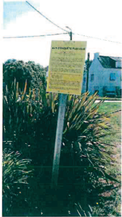
Entrée de Bieuzy-Lanvaux (devant dans le café)