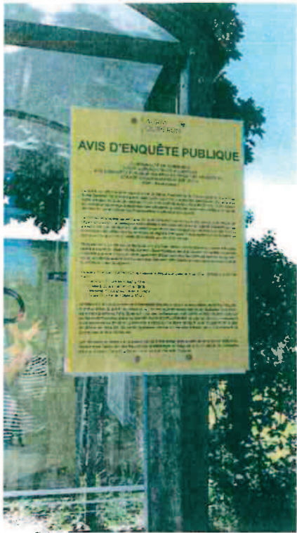
Route de Ste Anne d'Auray