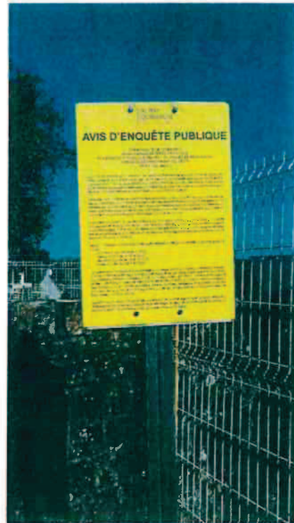
Rond-Point St-Michel (près du collège)