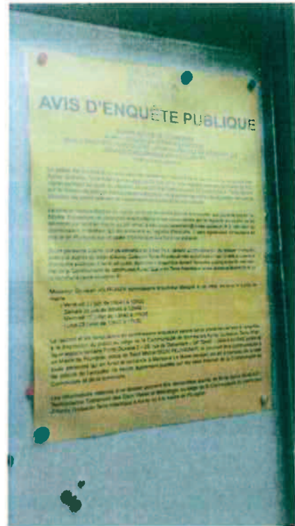
Siège Communauté de communes Auray Quiberon Terre Atlantique