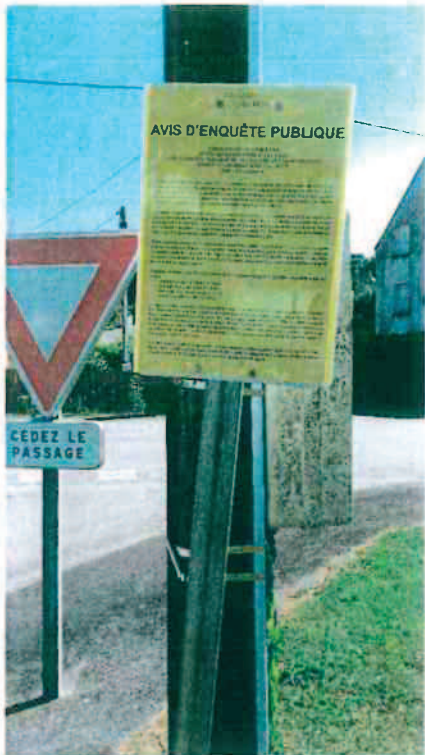
Résidence Les Pins à Bieuzy Lanvaux