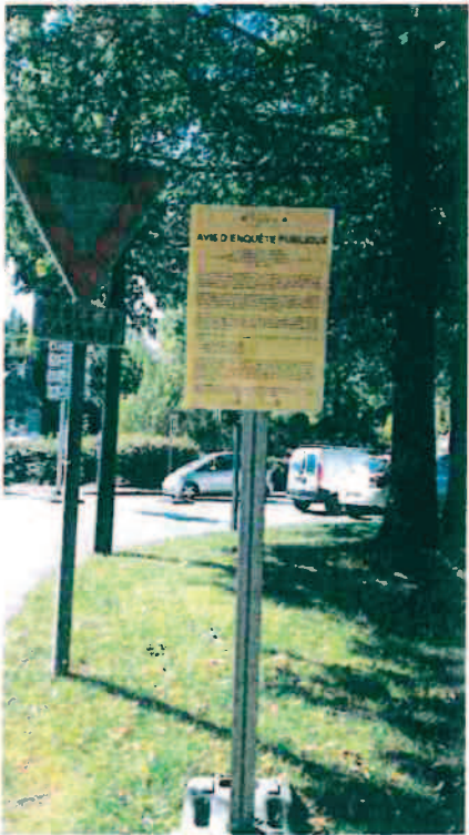
Route de Landaul